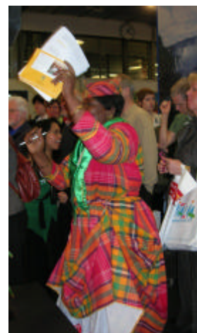
Trinidad & Tobago bjöd på karibiskt gung. Rosa svarade med dominikanskt gung i den högre skolan.

Det finns all anledning för Rosa och SWEDOM att vara nöjda med vår medverkan i TUR 06.