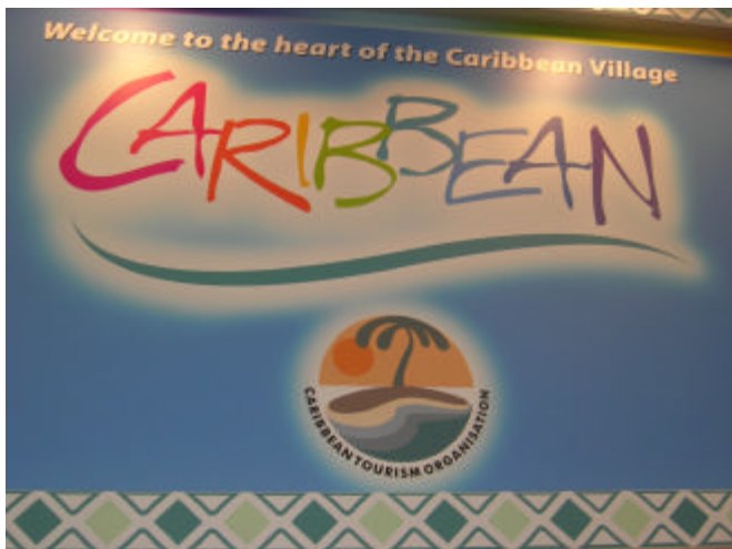
Besökarna hälsas välkomna till Caribbean Village på TUR 06.