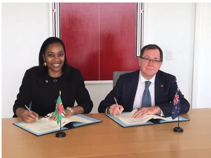
Dominicas utrikesminister Francine Baron och hennes kollega Murray McCully från Nya Zeeland.

Genom åren har politiker på Dominica lovat att anläggningen skulle komma igång inom kort. Men alla löften har visat sig vara för optimistiska. Gång på gång har planerna spräckts.