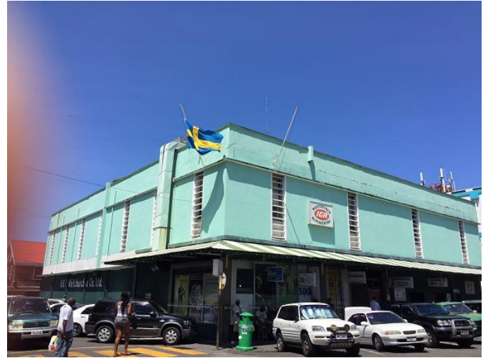
Sveriges konsulat ligger i Whitchurch varuhus.

open door policy for Swedes and my staff know when they come to the Consul... don't ask – just walk in. I have made quite a few friends from Sweden as consul and that I am happy for.