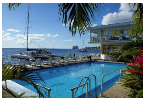
Polen på Anchorage Hotel