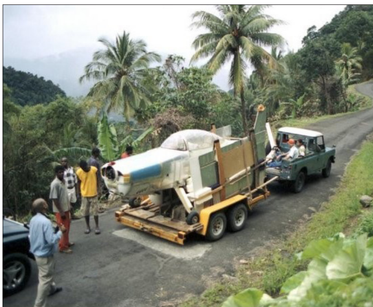
Nosparti på väg.